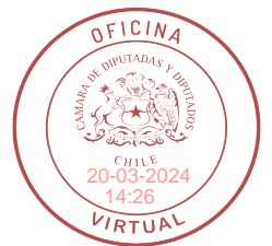
FIRMADO DIGITALMENTE: H.D. ALEXIS SEPÚLVEDA S.