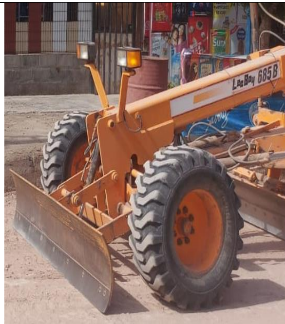
Fotografía N° 4: de fecha 1 de febrero de 2023: Maquinaria sin patente en calle Pintados entre Salitrera Alianza y Pampa Germania.