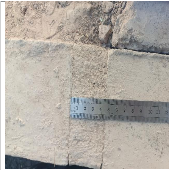
Fotografía N° 5, de fecha 13 de marzo de 2023: calle Libertad entre Arica y Pisagua acera poniente, se observa distanciamiento de solera de 4,5 cm