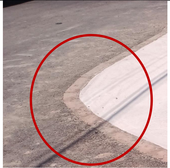
Fotografía N° 2, de 13 de marzo de 2023: calle El Minero con esquina Cala-Cala, acera oriente, se instalan soleras rectas.