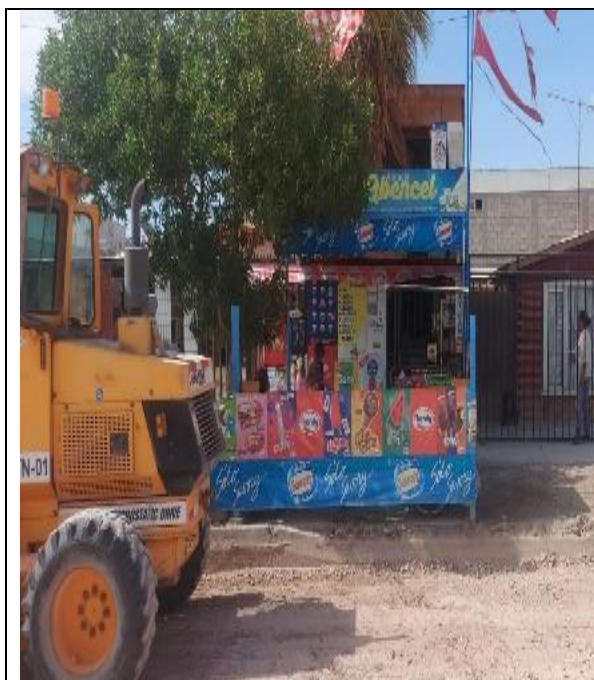
Fotografía N° 5, de fecha 1 de febrero de 2023: Maquinaria sin patente en calle Pintados entre Salitrera Alianza y Pampa Germania.