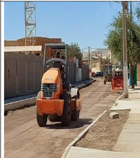
Fotografía N° 3: de fecha 11 de enero de 2023: Rodillo compactador sin patente, ubicado calle Libertad entre Arica y Pisagua.