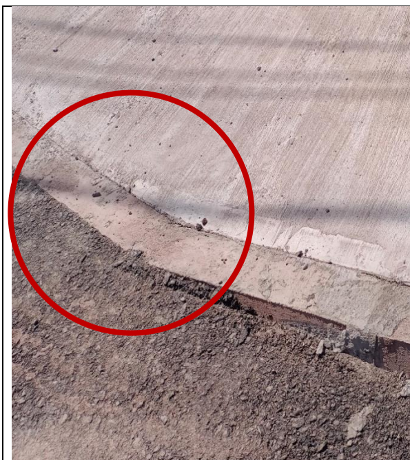
Fotografía N° 5, de 13 de marzo de 2023: calle Pintados con esquina Pampa Germania, acera norte, se instalan soleras rectas.