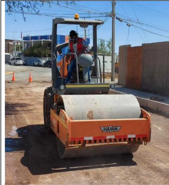
Fotografía N° 1, de fecha 11 de enero de 2023: Rodillo compactador sin patente, ubicado calle Libertad entre Arica y Pisagua.