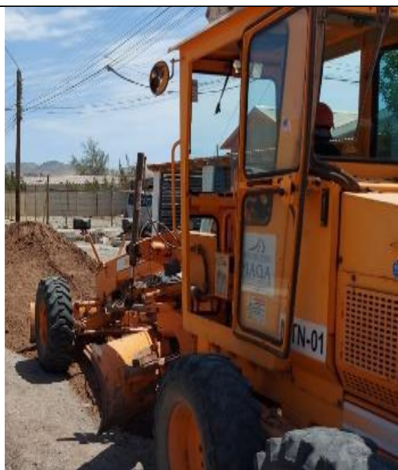
Fotografía N° 6, de fecha 7 de febrero de 2023: Maquinaria sin patente en calle El Minero entre Arica y Pisagua.