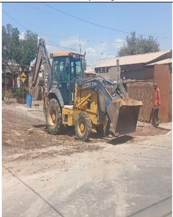
Fotografía N° 8, de fecha 13 de marzo de 2023 correspondiente a retroexcavadora patente JCPJ82., ubicado en calle Santa Laura.