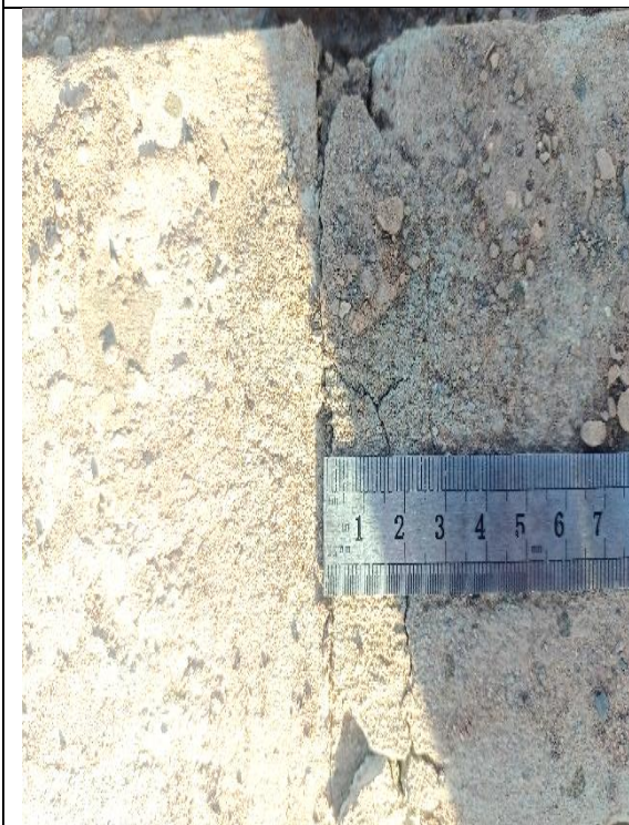
Fotografía N° 6, de fecha 14 de marzo de 2023: calle El Minero entre Cala-Cala y Pisagua acera poniente, se observa distanciamiento de solera de 3 cm.