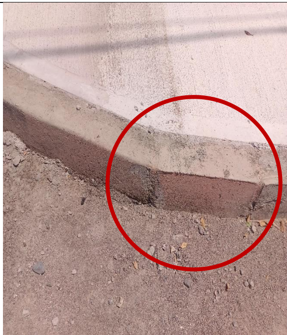
Fotografía N° 3, de 13 de febrero de 2023: calle El Minero con esquina Pisagua, acera oriente, se instalan soleras rectas.