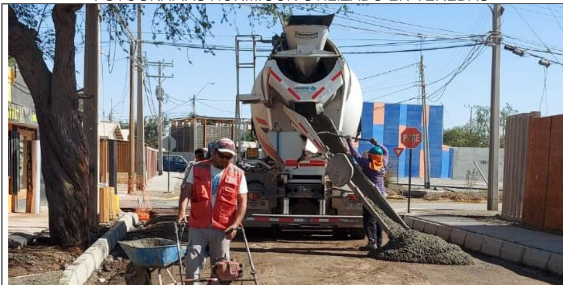
Fotografía N° 1: calle Libertad entre Arica y Pisagua acera oriente, se observa suministro de hormigón premezclado en camión mixer