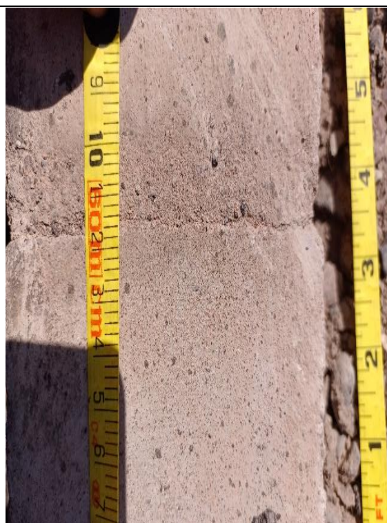
Fotografía N° 9, de fecha 14 de marzo de 2023: calle Libertad entre Arica y Pisagua acera poniente, se observa distanciamiento de solera de 2 cm.