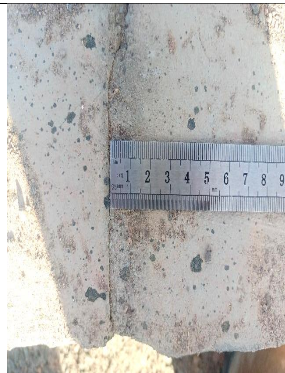
Fotografía N° 7, de fecha 14 de marzo de 2023: calle El Minero entre Cala-Cala y Pisagua acera poniente, se observa distanciamiento de solera de 2 cm.