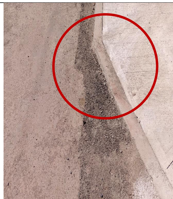
Fotografía N° 6, de 13 de marzo de 2023 calle Pintados con esquina Pampa Germania, acera norte, se instalan soleras rectas.