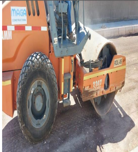
Fotografía N° 2: de fecha 11 de enero de 2023: Rodillo compactador sin patente, ubicado calle Libertad entre Arica y Pisagua.