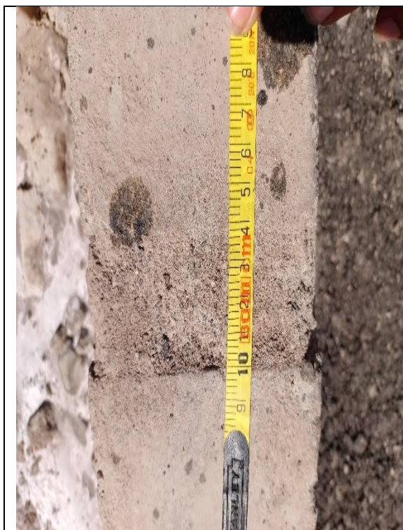
Fotografía N° 8, de fecha 14 de marzo de 2023: calle Pintados entre Salitrera Alianza y Pampa Germania acera norte, se observa distanciamiento de solera de 4 cm.