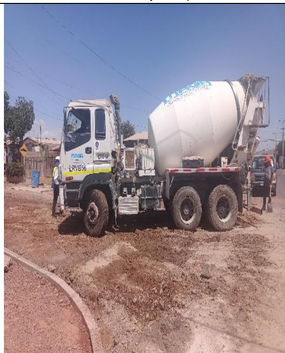
Fotografía N° 7, de fecha 13 de marzo de 2023 correspondiente a camión mixer patente LRVB56, ubicado en calle Santa Laura.