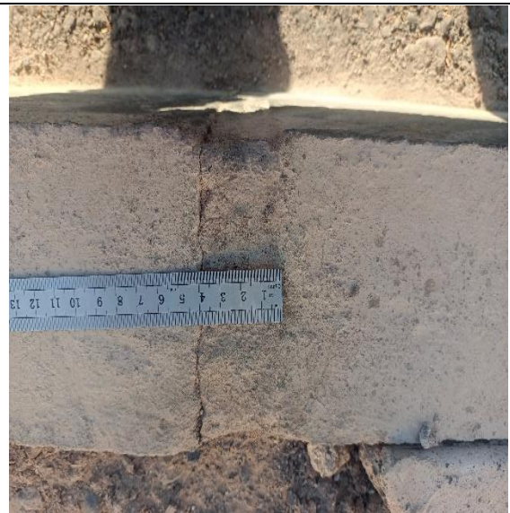
Fotografía N° 6, de fecha 13 de marzo de 2023: calle Libertad entre Arica y Pisagua acera poniente, se observa distanciamiento de solera de 4 cm