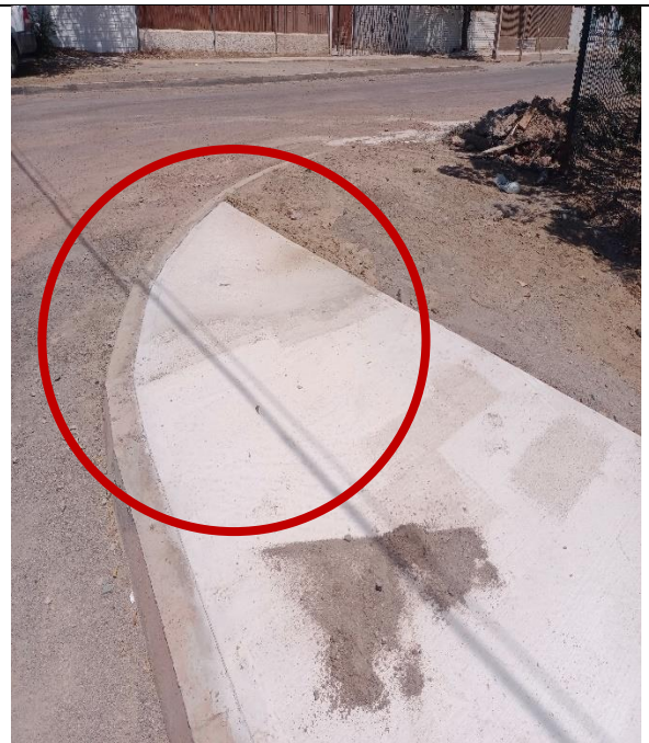
Fotografía N° 4, de 13 de febrero de 2023: calle El Minero con esquina Pisagua, acera oriente, se instalan soleras rectas.