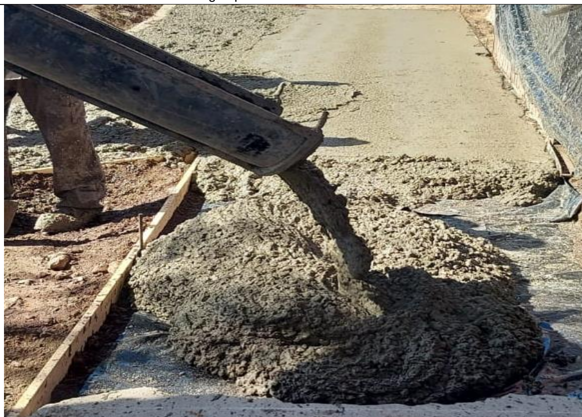
Fotografía N° 2: calle Libertad entre Arica y Pisagua acera oriente, se observa suministro de hormigón premezclado en camión mixer